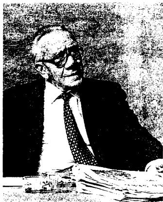
Nuto Revelli a Racconigi

Iniziano questa settimana le manifestazioni organizzate in città per ricordare il 25 aprile, anniversario della Liberazione dai nazifascisti. Venerdì 17 aprile , infatti, presso la sala Donegani nell'ex Ospedale civile (ore 21, ingresso da piazza Santa Maria) è in programma una serata in ricordo di Nuto Revelli, a cura delle sezioni cittadine